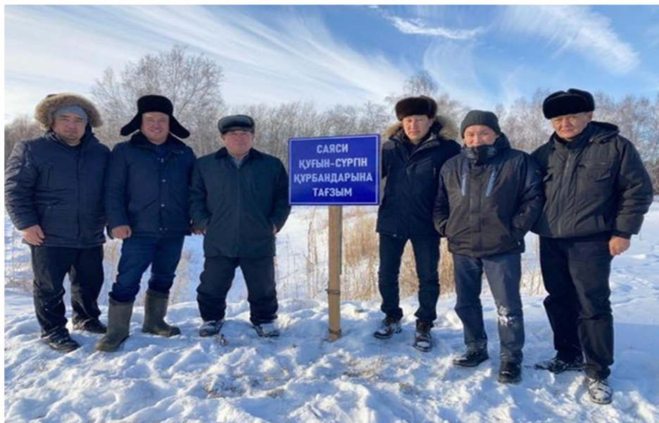
1-сурет. Далалық зерттеу экспедиция тобының мүшелерінің еңбекпен түзету лагерінің орнына ескерткіш тақта орнату сәті

Қазақстан Республикасы Президенті Қасым-Жомарт Тоқаевтың 2021 жылдың 24 қарашасында саяси қуғын-сүргін құрбандарын толық ақтау жөніндегі Жарлығынан кейін Ш. Уәлиханов атындағы Көкшетау университеті жанындағы «XX ғасырдың 20-50 жж. Саяси қуғын-сүргін құрбандарын ақтау жөніндегі Жобалық кеңсе» құрылып, аталмыш бағытта зерттеу жұмыстарын қолға ала бастады. Ақмола облысының осы Жобалық кеңсесі еліміздің өзге облыстарында құрылған кеңселер сияқты саяси қуғын-сүргін құрбандарын ақтау бойынша жұмыстарды бірнеше бағытта жүргізгенімен, зерттеу жұмыстарын осы ГУЛАГ лагерлер жүйесінде жапа шеккен құрбандарын ақтау бойынша жүргізген болатын (1-сурет).