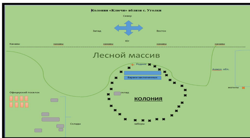
2-сурет 2 «Ключи» ОЛП-3 лагерінің орналасу сызба-нұсқасы