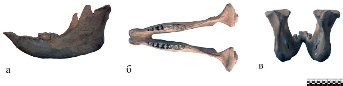
3 - Сурет. №83 Жүндес мүйізтұмсықтың төменгі жақ сүйегі а-бүйірлік көрініс; б-жоғарыдан көрініс; в-артқы көрініс.

№83 төменгі жақ сүйегі кремді дақтары бар қоңыр түсті. Ол төмен профильді және ұзын тіс қатарымен ерекшеленеді, оған үлкен призматикалық тіс тәждері кіреді (3-сурет). Бұл морфологиялық ерекшеліктер жүндес мүйізтұмсықтың тіс жүйесінің ашық ландшафттарда өмір сүруіне тән өсімдік тағамдарын тиімді шайнауға бағытталған ерекше бейімделуін көрсетуі мүмкін.