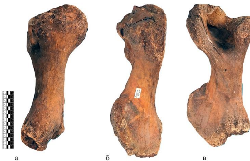
4- Сурет. №83 Жүндес мүйізтұмсықтың иық сүйегі а-медиальды көрініс; б-бүйір жағы; в-артқы көрініс.

Палеонтологиялық қазба жұмыстары кезінде Батыс Қазақстандағы Жайық өзенінің төменгі ағысы бассейнінде ашық-қоңыр түсті иық сүйегі табылды (4-сурет).